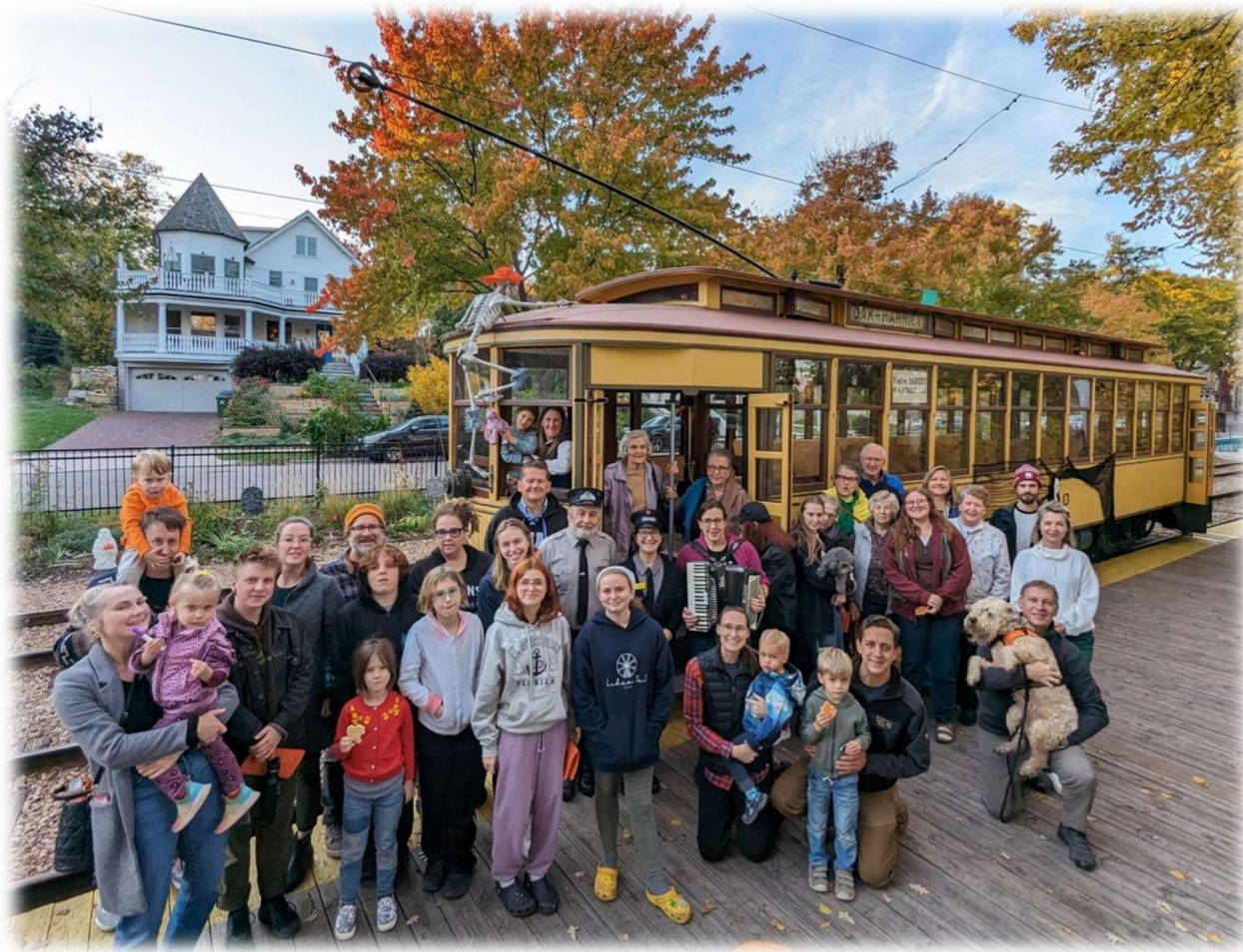
Kuplais dziedātāju pulks!

Bija prieks redzēt kuplo dziedātāju pulku (ap 40). Ģimijām bija prieks par ģimenēm ar bērniem un jauniešiem - aug jaunā dziedātāju maiņā! Tramvaja braucienā līdzi devās arī 2 sunīši. Tie gan no dziedāšanas atturējās 😊